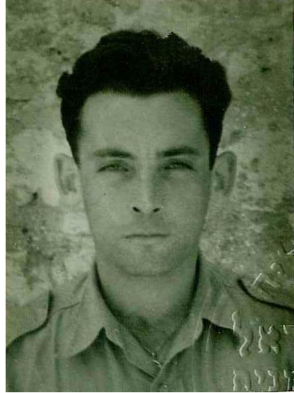
חוברת זו מוקדשת לאבי יוסף (ז'וסקה) בליץ ז"ל אסיר מחנה אושוויץ - מס' 66200 לוחם חטיבת הנגב - מ.א. 73678 נמנה עם מגני בית אשל ונבטים